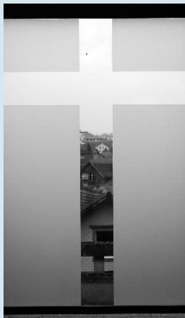
Das Kreuz auf dem Abdankungsplatz: Erinnerung an das Sterben und Symbol der Hoffnung.

Die Erinnerung an gute und schwere Zeiten, der Schmerz über den Verlust eines geliebten Menschen, auch die Möglichkeit, aus und mit der Trauer in ein – verändertes – Leben zurückzufinden, diese Themen werden uns im Gottesdienst am 21. November begleiten. Mit Orgel- und Violoncellomusik, Gebeten, Liedern, Predigtgedanken, dem Entzünden von Kerzen und Momenten der Stille wollen wir am Ewigkeitssonntag unseren Gefühlen Raum geben und sie vor den ewigen Gott bringen. Seien Sie herzlich willkommen. Pfr. Lars Altenhölcher